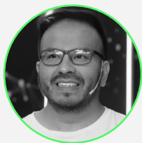
INTELIGENCIA ARTIFICIAL FREDI VIVAS ROCKING DATA.AI